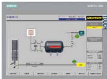
H3700, 通过彩色图像展示

纳博热在标准化和客户化控制装置设计及制造方面具有非常丰富的经验。控制装置不仅操作便捷，而且自基本结构起便已具备多种基本功能。