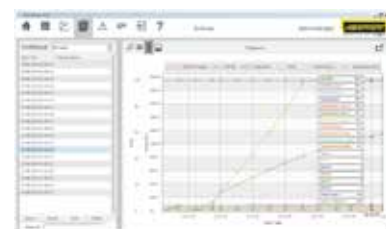
用图表来显示的工艺曲线