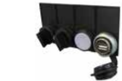
NTLog Comfort 用于供西门子可编程控制器来记录数据