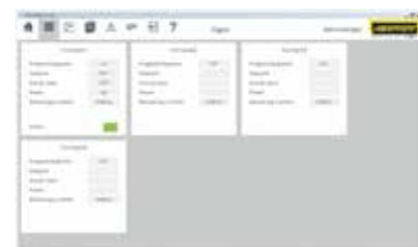
用图表来显示的概览（带有 4 台炉的版本）