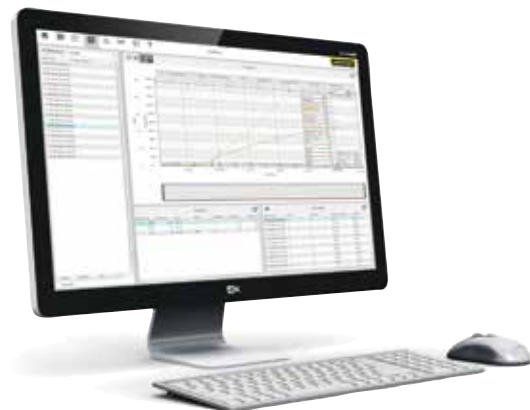
VCD 软件用于控制、可视化和记录

VCD 软件用于记录 B400/B410, C440/C450 和 P470/P480 型控制器的工艺数据。可以储存最多400 个不同的热处理程序。控制器通过软件来启动和停止。工艺得到记录并被相应存档。可以用一张图表或作为数据列表来显示数据。也可以将工艺数据传输给MS Excel（以*.csv 格式）或以PDF 格式来生成一份报告。