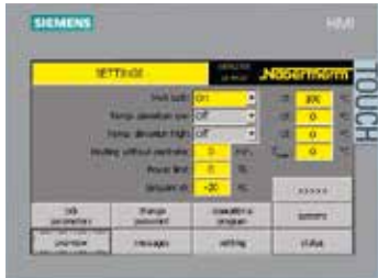
H1700, 通过彩色表格显示