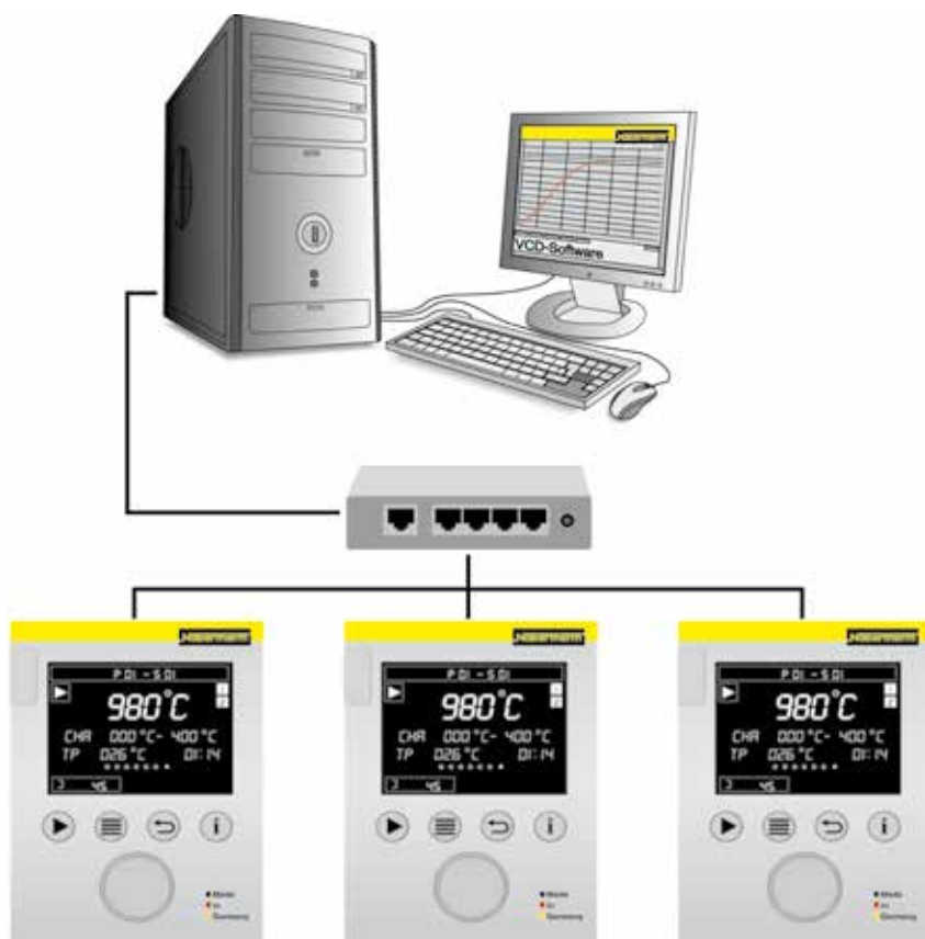
举例说明3台窑炉的配置