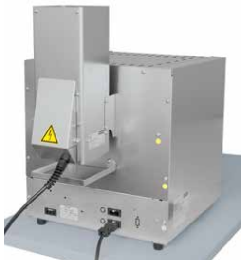
标准实验室马弗炉 L 5/11, 带催化净化器 KAT 50见第12页

用于废气净化, 特别是在排胶时, 纳博热提供量身定做的废气净化系统。后燃烧系统固定连接在炉子的排气接管上并且相应地接入到炉子的控制装置和安全装置中。对于现有的炉子而言, 可以提供独立的废气净化系统, 进行独立控制和驱动。