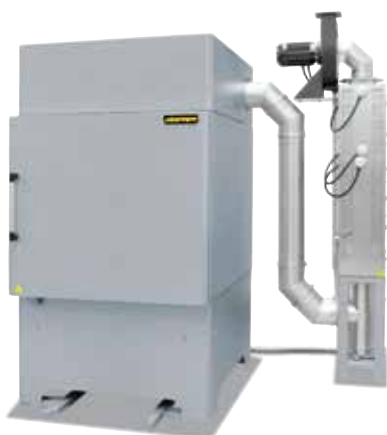
带有催化后燃烧装置的 NA 500/65 DB200 型箱式炉