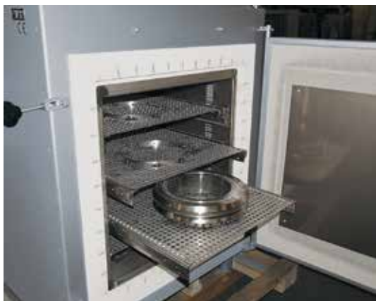
带装料栅架的空气循环炉。各插板可以通过滑道移动并单独取出。