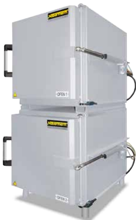
由两个N 60/65 HA型空气循环炉组成的双箱式炉系统，带电动旋转门开启装置，可方便冷却和简化给窑炉的装料

通过给窑炉配置合适的装料配件可以在很多情况下大大加快或简化热处理进程并提高生产效率。我们为您在该领域提供各种解决方案，本页所列出的只是其中的一小部分。欢迎您垂询我们的配件供应，我们乐意为您研制符合您需求的特殊解决方案。