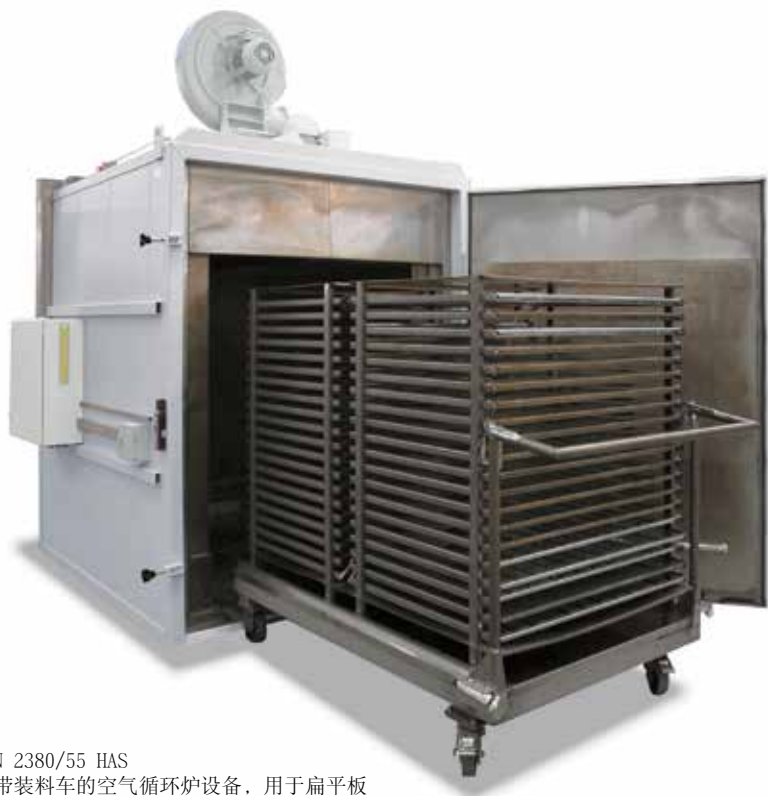
N 2380/55 HAS 带装料车的空气循环炉设备，用于扁平材料回火