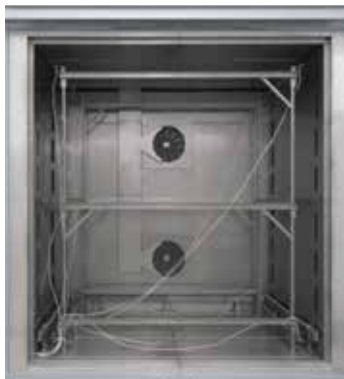
可插入式测试架用于空气循环箱式炉 N 7920/45 HAS 的测试