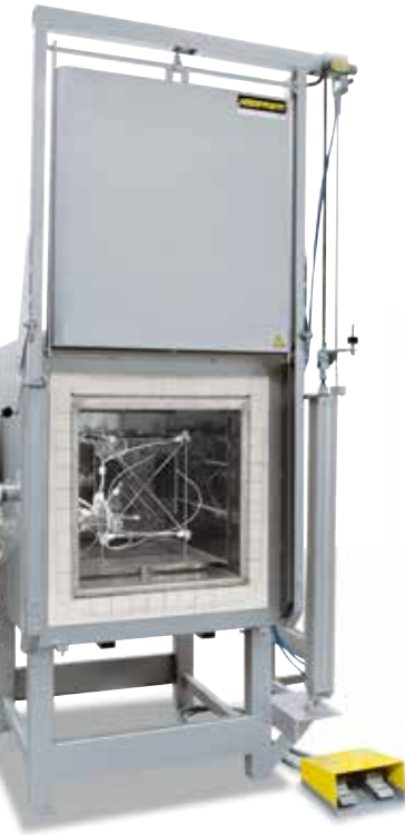
用来确定温度均匀性的测量架