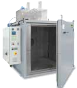
用于3D打印后进行粘接剂固化的干燥炉KTR 2000