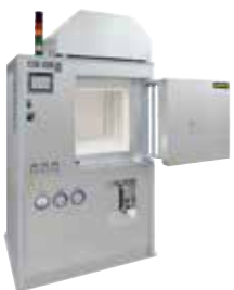
HT 160/17 DB200 型用于排胶以及在 3D 打印后烧结陶瓷

附加制造可将产品结构设计文件直接转换成功能齐全的产品。通过 3D 打印技术，由金属、玻璃、塑料、陶瓷、玻璃、沙或其他材料制成的产品，被层层组装起来，直至达到它们的最终形状。