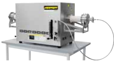
紧凑的管式炉用于在 3D 打印后的烧结或在保护气体或真空下进行去应力退火