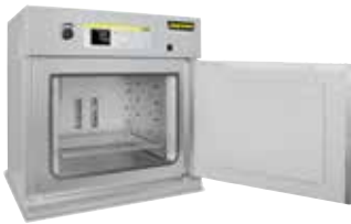
TR 240 型烘干箱用于烘干粉末