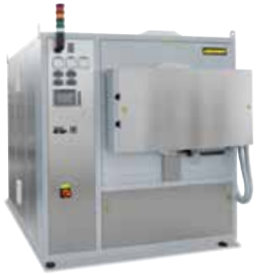
NR 150/11 型罐式炉用于在3D打印后对金属部件进行去应力退火