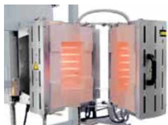
RS 100/250/11S, 可折叠, 可安装在一台检测试验装置内