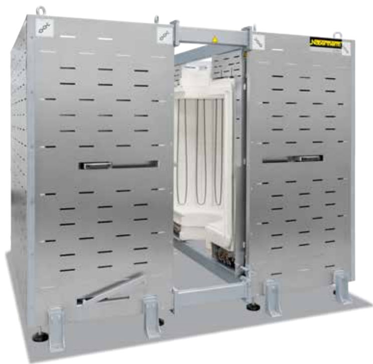
RS 460/1000/16S, 集成在生产工厂