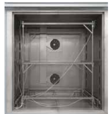
可插入式测试架用于空气循环箱式炉 N 7920/45 HAS 的测试