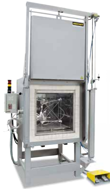
用来测量温度均匀性的测量架

对于标准炉来说，无需测量便可保证用 \pm K 表示的温度均匀性。作为额外装置，在额定温度下，可以在有效加热区内根据 DIN 17052-1 订购温度均匀性测量装置。根据加热炉的型号会在炉中安装一个和有效空间尺寸一致的支架。将热电偶固定在支架上的 11 个设定的测量位置。在用户给定的额定温度下，在预先设定的恒温时间后进行温度均匀性的测量。根据要求，也可校准不同的额定温度或设定的额定工作区。