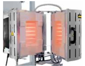
RS 100/250/11S, 可折叠, 可安装在一台检测试验装置内

在基本炉型的基础上，我们也可以为上级工艺设备专门定制特殊炉型。此页内列举的仅仅是众多设备方案中的几种。无论是真空还是保护气氛操作，无论是创新的控制技术还是自动化，也无论管式炉的温度、规格、长度和性能如何，我们都能为您找到一种最佳的工艺优化方案。