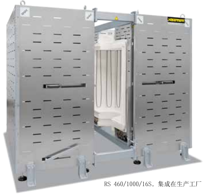
RS 460/1000/16S, 集成在生产工厂