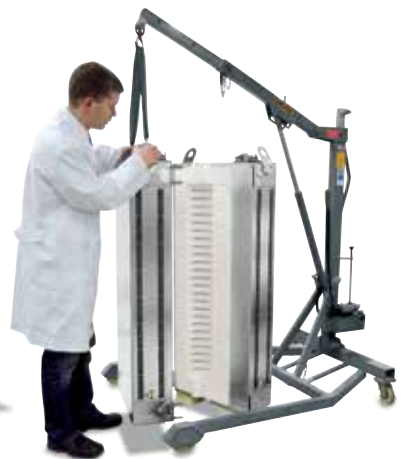
分开的RS 120/1000/11S炉。相同的两半炉体通过节省空间的设计组合在一套加热系统之中