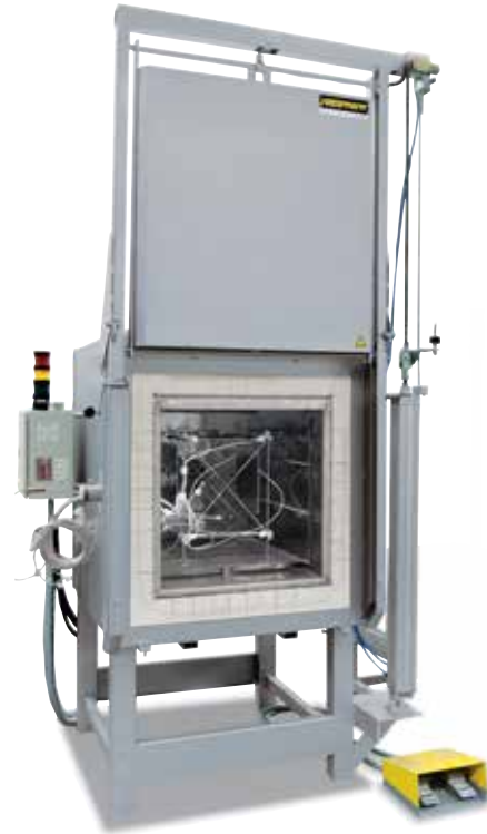
用来测量温度均匀性的测量架

对于标准炉来说，无需测量便可保证用 \pm K 表示的温度均匀性。作为额外装置，在额定温度下，可以在有效加热区内根据 DIN 17052-1 订购温度均匀性测量装置。根据加热炉的型号会在炉中安装一个和有效空间尺寸一致的支架。将热电偶固定在支架上的 11 个设定的测量位置。在用户给定的额定温度下，在预先设定的恒温时间后进行温度均匀性的测量。根据要求，也可校准不同的额定温度或设定的额定工作区。