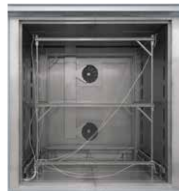
可插入式测试架用于空气循环箱式炉 N 7920/45 HAS 的测试