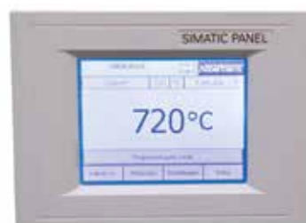
控制器，热电偶和有效加热区的误差总和为系统准确性

对于标准炉来说，无需测量便可保证用 \pm K 表示的温度均匀性。作为附加装备，在规定温度下，可以在有效加热区内根据 DIN 17052-1 订购温度均匀性测量装置。根据加热炉的型号，会在炉中配备一个和有效空间尺寸一致的支架。将热电偶固定在支架上规定的测量位置（11支热电偶放置在方形截面，9支热电偶放置在环形截面）。在用户给定的规定温度下，在预先规定的恒温时间后进行温度分布的测量。根据要求，也可校准不同的额定温度或定义的额定工作区。